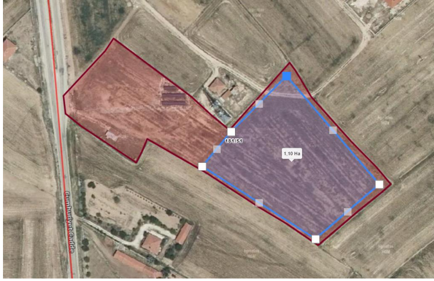
Resim 2. Yamaçlı Belediyesi Güneş Enerji Santrali Proje Sahası

varılmıştır. Yozgat ili fay hatları üzerinde yer aldığından orta derecede deprem riski taşımaktadır. Bu nedenle risklere karşı önlem almak adına tasarım ve inşaat esnasında “Afet Bölgelerinde Yapılacak Yapılar Hakkında Yönetmeliğin” ilgili maddesine uyulacaktır.